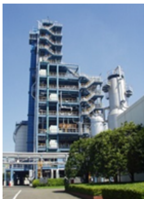
川崎プラスチックリサイクル（KPR）プラント

※3 世界で唯一20年にわたり安定運転しているガス化ケミカルリサイクルプラント。2003年に稼働開始し、日本のケミカルリサイクルの約22%に相当する年間約7万トンの使用済みプラスチックをガス化している。KPRで取り出された水素の一部は近隣プラントで化学原料向けや燃料電池自動車向けに活用されるほか、環境調和型アンモニア「エコアン®」の原料となる。またCO2は大気中に放出することなくドライアイスや炭酸飲料、医療用炭酸ガス向けの原料に使用されるなど、資源循環を実現している。