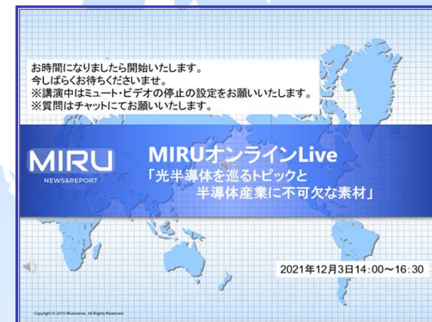
各分野の専門家・第一人者を お迎えしてのMIRU主催オンラインLive

MIRU.comでは、企業様・学生向けのセミナー・講演会等も行っております。（オンライン/オフライン共） ご興味がございましたら、担当までお問合せ下さい。