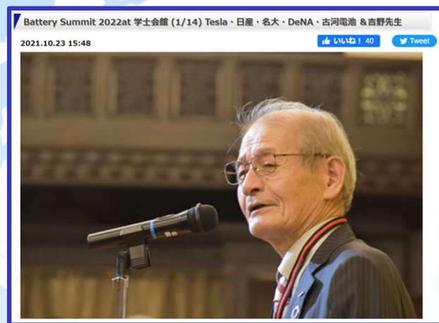
旭化成吉野彰先生をメインスピーカーにお迎えする「BatterySummit」

講演会&セミナーには、鉄鋼、非鉄金属、レアメタル及びエレクトロニクス業界の第一級の専門家、学者を始め、官庁、メーカー、リサイクラー、商社等、その他様々な業種の方々が参加。年間5～7回行われる例会では、幅広いテーマの講演会&交流会が開催され、明日の高度技術社会の未来を考える議論を展開しており、従来産業の垣根を越えた商交流も数多く生まれている。