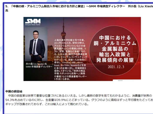
メディアパートナーとの共同オンラインLive