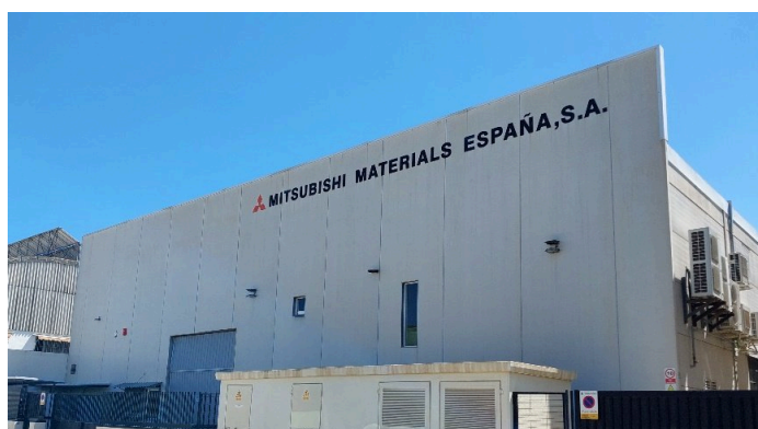
拡張したインサート製造工場

三菱マテリアル株式会社はスペイン、バレンシアにある工場の拡張工事を進めてまいりました。当初の予定通り拡張を完工し、5月から稼働を開始しました。このたびの拡張完工により、スペイン バレンシア工場におけるインサートの生産能力は従来の2～5倍に増強されます。