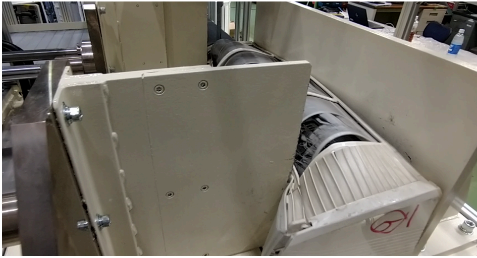
プレス治具にて解体される様子 (装置製作時)