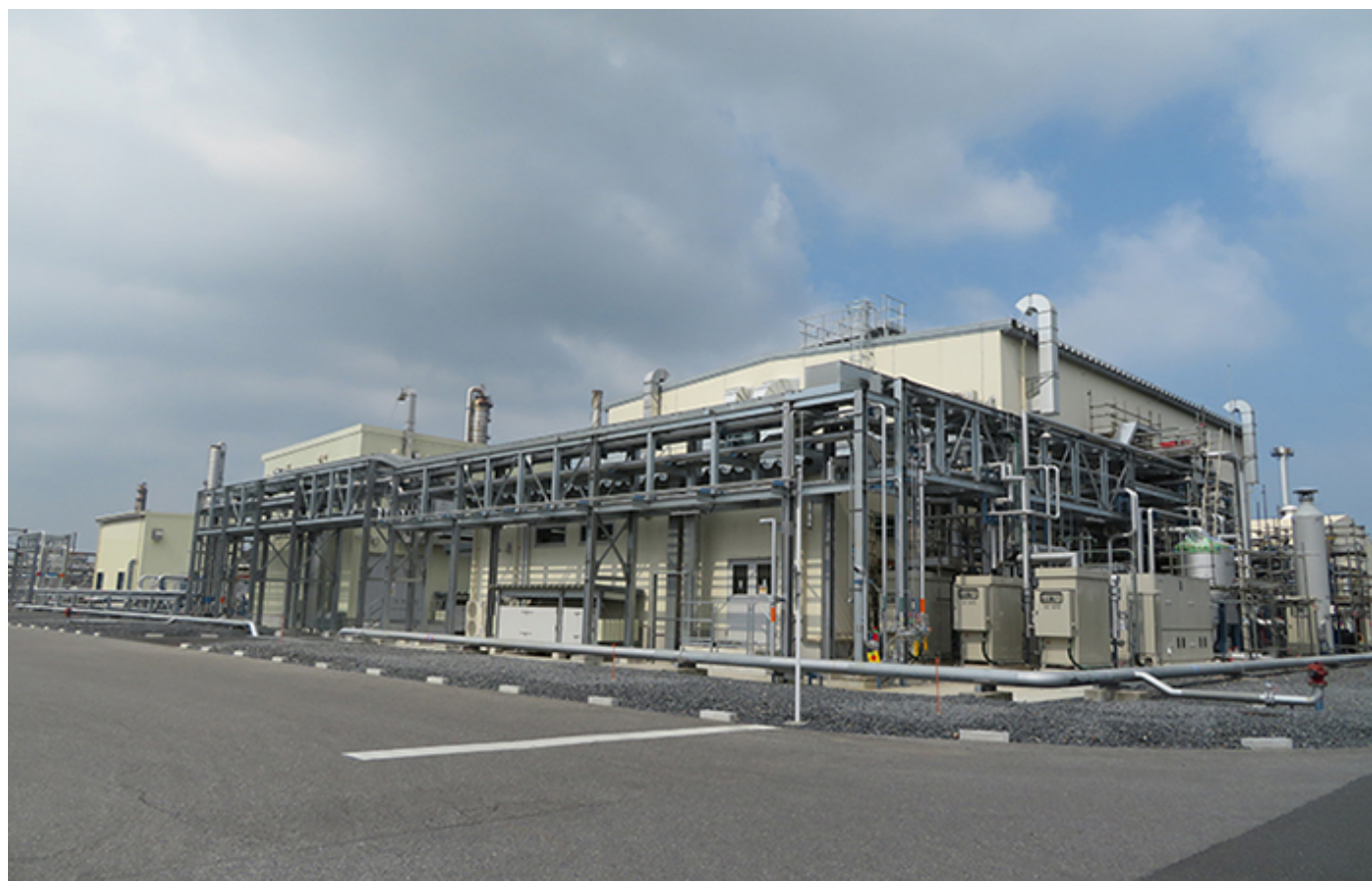
今回能増する第1プラント外観

出光興産株式会社（本社：東京都千代田区、代表取締役社長：木藤 俊一）は、全固体リチウムイオン二次電池（以下「全固体電池」）の普及・拡大へ向け、固体電解質の小型実証設備第1プラント※ 1 （稼働開始：2021年11月）の生産能力を増強します（完工時期：24年度内を計画）。加えて本年7月より小型実証設備第2プラント※ 2 の稼働も開始し、全固体電池の開発を進める自動車・電池メーカーなどへ、当社の固体電解質を着実に供給してまいります。