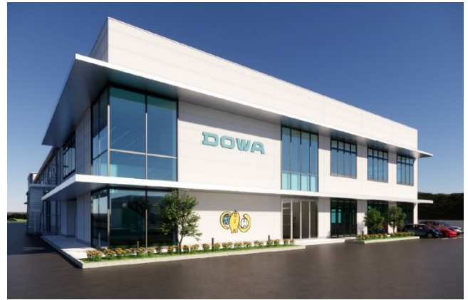
アクトビー分工場の完成予想図