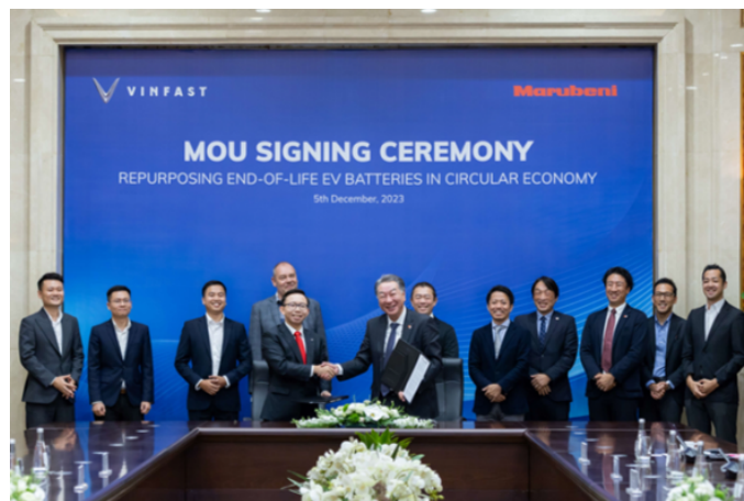
覚書署名式の様子

再生可能エネルギー（以下、「再エネ」）電源の増加による系統負担の増大は、再エネ拡大を阻害する社会問題として顕在化し始めています。また、EVバッテリーの生涯価値の最大化は、世界的なEV普及に不可欠です。丸紅は、使用済みEVバッテリーを活用した電力需給調整と系統負担の緩和に着眼し、2021年に米国のスタートアップ企業B2U Storage Solutions, Inc.（以下、「B2U」）へ出資参画しました。本覚書では、使用済みEVバッテリーを解体・再検査・再梱包することなく、定置型として安価で容易に二次利用できるB2Uの独自開発技術を活用することで、VinFast製EVに搭載されるバッテリーを定置型に転換することを検証します。