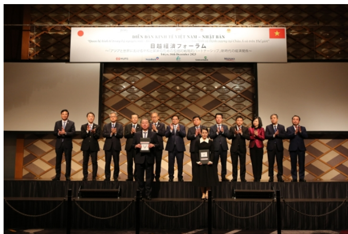
覚書交換式の様子

本覚書で両社は、VinFastが製造するEVに搭載されたバッテリーを定置型として二次利用する実証を行うことや、使用済みEVバッテリーの利活用やサーキュラーエコノミーのモデル構築の促進に繋がる事業の創出で協調することを目指しています。